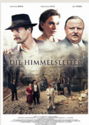
Die Himmelsleiter Spielfilm