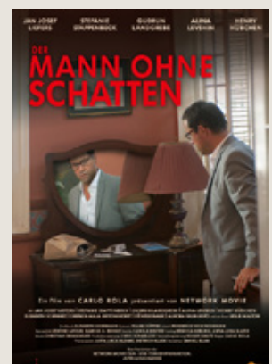
Mann ohne Schatten Spielfilm