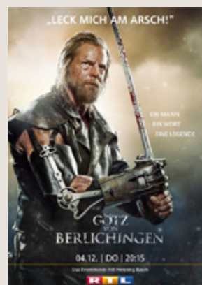
Götz von Berlichingen Spielfilm